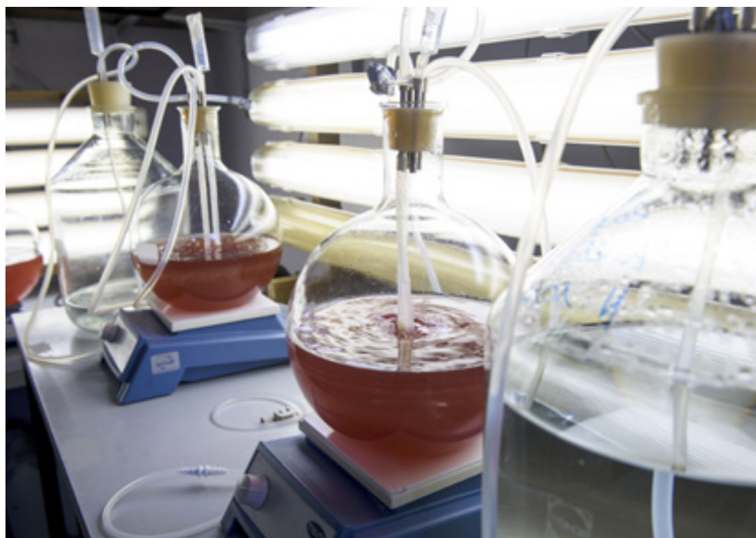
På Marinbiologisk Forskningscenter i Kerteminde dyrker man selv algeblandingen, som muslingerne bliver "fodret" med.

En høst på 1000 ton blåmuslinger svarer til at fjerne 10 ton kvælstof fra marine-miljøet.